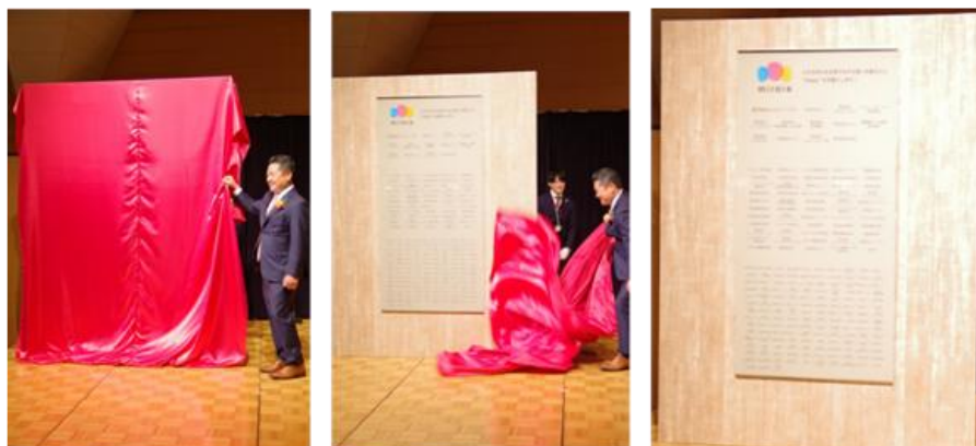
支援企業を記したスポンサーボードの除幕セレモニー

「感謝の意を表すと共に、楽しくチャリティーに参加する！」をテーマに 11 月 23 日（日・祝）東京アメリカンクラブにて第 4 回 miraie チャリティーパーティーを開催いたしました。今年は 140 名の賛助会員の皆様が参加され、今年一年の活動報告をすると共に支援者の皆様に感謝の気持ちを伝えました。