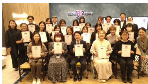
東京会場の参加者

また研修修了後も相互にコミュニケーションが図れるようにグループ LINE で情報を共有し、さらに来年にはフォローアップ研修を実施する予定で、アンバサダーがワーキングマザーに寄り添って活動ができるようにサポートをしています。