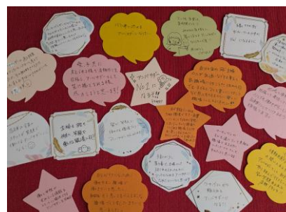
終了時に参加者が書いたメッセージ