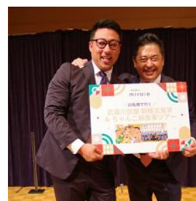
イルミネーションジャグリングショー、チャリティーラッフル抽選会の様子